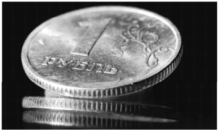
„Jede Nacht, jeden Tag auf der Jagd, denn das Rudel tollt, wenn der Rubel rollt!“, sangen die Absolventen im Jahr 1999 passend zur damaligen Rubelkrise.

Der richtige Schritt Russlands wäre es, nun dem Westen Zugeständnisse zu machen, um die Sanktionen zu lockern. Sehr unwahrscheinlich, dass das passiert, wenn man Putins Bären-Vergleiche hört. Viel wahrscheinlicher erscheint eine Möglichkeit, die der amerikanischen Ökonomen Paul Krugman umschreibt mit der Metapher „auf die Malvinas einfallen“. Gemeint sind die Falkland-Inseln, britisches Hoheitsgebiet vor Argentinien, die Argentinien 1982 besetzte, um von der schlechten wirtschaftlichen Lage abzulenken. Zu solchen Reaktionen hat Putin eher einen Hang als zu Zugeständnissen.